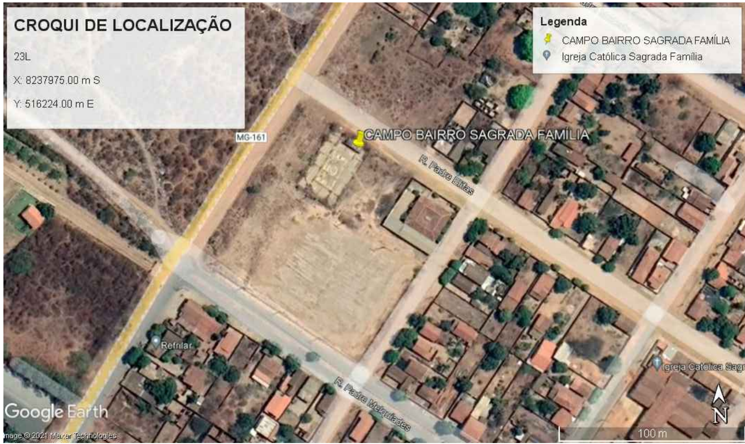
03 CROQUI DE LOCALIZAÇÃO SEM ESCALA